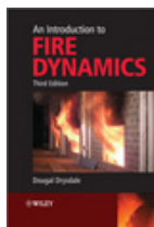
Introduction to Fire Dynamics