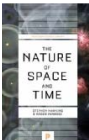
The Nature of Space and Time / Stephen Hawking, Roger Penrose