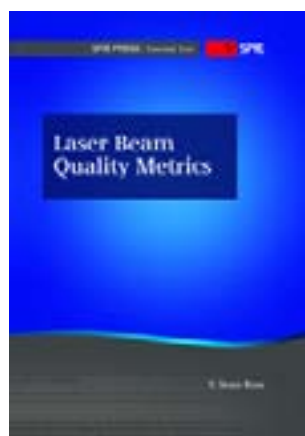
Laser beam quality metrics / T. Sean Ross