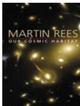
Our cosmic habitat / Martin Rees